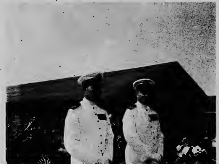
..... E homber cu ta bay y esun cu a tuma over.....